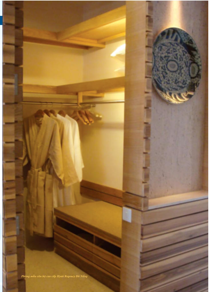
Phòng mẫu căn hộ cao cấp Hyatt Regency Đà Nẵng