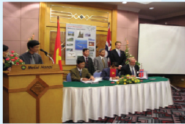
Lễ ký kết hợp tác nghiên cứu sản xuất Tấm Xi Măng Sợi PVA giữa Viện Vật Liệu Xây dựng Việt Nam và Elkem - Norway, NAVIFICO

Mười năm qua, kết quả đạt được của mỗi năm đều gắn liền với những kỳ vọng để chuẩn bị cho sự phát triển nhằm phát huy năng lực lõi của công ty trong lĩnh vực sản xuất Tấm Xi Măng Sợi, tạo thêm sản phẩm cung ứng cho thị trường theo xu hướng xây dựng môi; chú trọng xây dựng đội ngũ thiết kế kỹ thuật chuyên nghiệp, trong lĩnh vực sản xuất chế biến gỗ và chủ động tạo những dòng sản phẩm mới nhằm đáp ứng nhu cầu ngày càng đa dạng của thị trường.