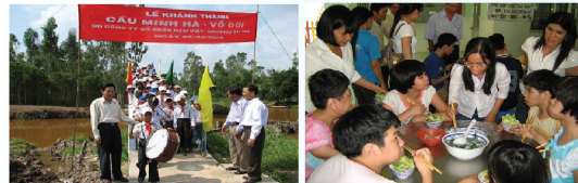
Công tác xã hội và từ thiện