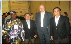
Tham dự Hội Nghị Quốc Tế về Xi Măng Sợi (IIBCC), Brazil - 2006