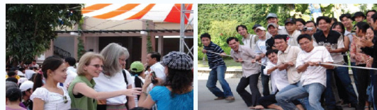
Hợp một vui xuân